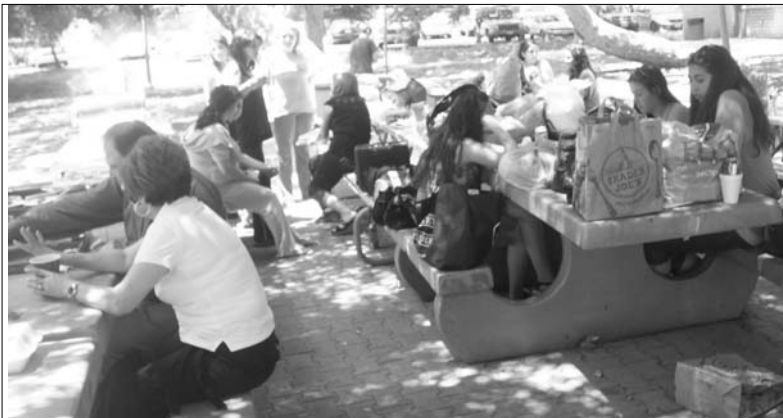
Դաշտագնացութենէն տեսարան մը:

Հինգշաբթի, 3 եւ Ուրբաթ, 4 Յունիսին , նախամանկապարտէզի, մանկապարտէզի եւ նախակրթարանի փոքրիկները, իսկ միջնակարգի եւ երկրորդականի աշակերտները համապատասխանաբար ունեցան իրենց դաշտագնացութիւնը՝ picnic: Աշակերտները ամբողջ երկու օրերու ընթացքին վայելեցին Կլեմէնտյի Verdugo Park-ին բնութիւնը եւ շատ ուրախ ժամանակ անցուցին բաց երկինքին տակ եւ գեղեցիկ բնութեան մէջ զանազան խաղերով, մրցումներով եւ զուարճանքներով: