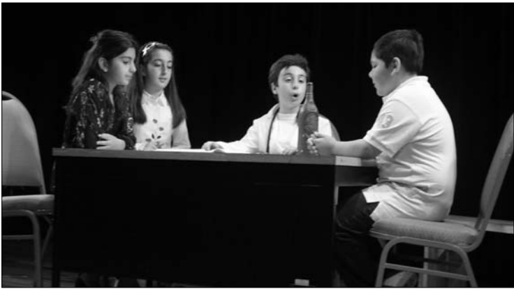
9-րդ դասարանի աշակերտները թատերական պատկեր մը կը ներկայացնեն: