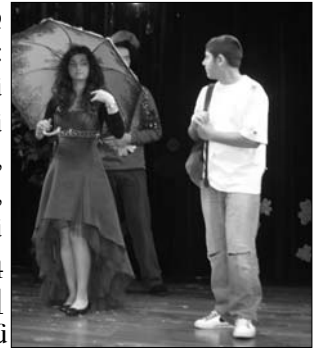
Անխելք մարդը կը մերժէ սիրուն աղջիկը եւ հարստութիւնը...

նոյնքան ալ բազմազան: Ամէն բանէ առաջ, վարժարանիս միջնակարգի աշակերտները, յօբելանին մասնակցեցան իրենց ձեռակերտ աշխատանքներով, որոնք կը ներկայացնէին բանաստեղծին գործերուն նիւթերը՝ “Չախորդ Փանոսը”, “Քաջ Նազար”, “Շունն ու Կատուն” եւ այլն, որոնք հանդիսատեսին ցուցադրուեցան սրահի միջանքին մէջ: Հանդիսութեան բացումը կատարեցին ասարտական դասարանի աշակերտները՝ ներկայացնելով Թումանեան մարդը, ազգային նուիրեալը, մշակոյթի ռահվիրան, հասարակական գործիչը, արուեստագէտը, մեծ մարդասէրը, զուարճախօս թամաղան, քաղաքական դէմքը, գրեթէ այն ամէնը ինչ կը կազմէ Թումանեան հանճարը: 9-րդ դասարանի աշակերտները բեմական պատկերով