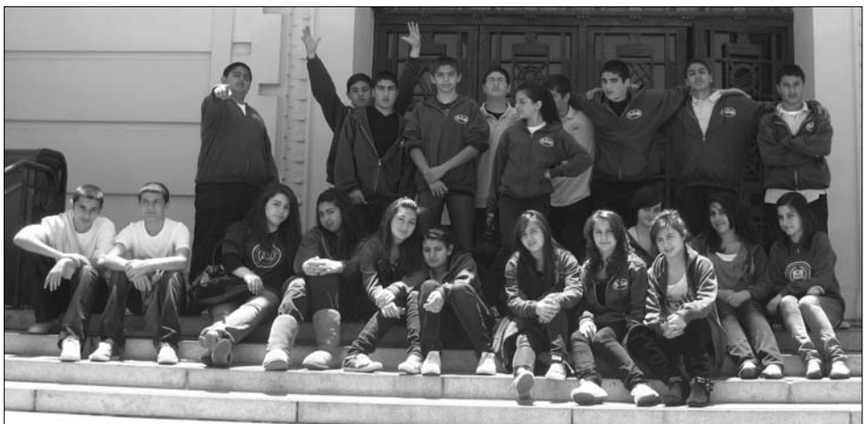
9-րդ դասարանի աշակերտները Griffith Observatory-ի շէմին: