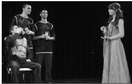
“Թմկաբերդի Առումը” ներկայացումէն պահ մը: