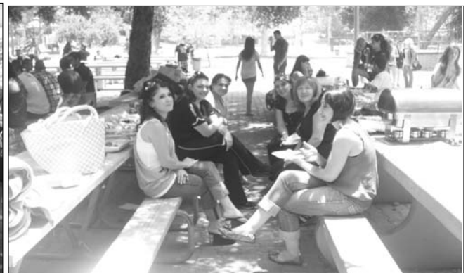
Ծնողները եւս հաճոյքով մասնակցեցան դաշտագնացութեան: